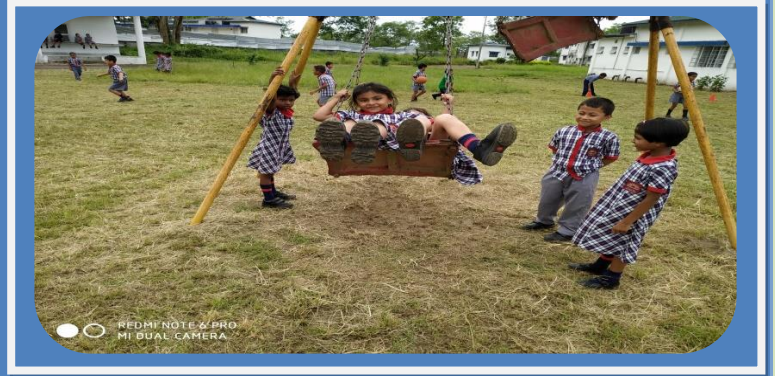
झुला झूलते हुए बच्चे