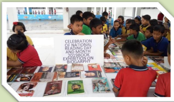
किताबे देखते विद्यार्थी