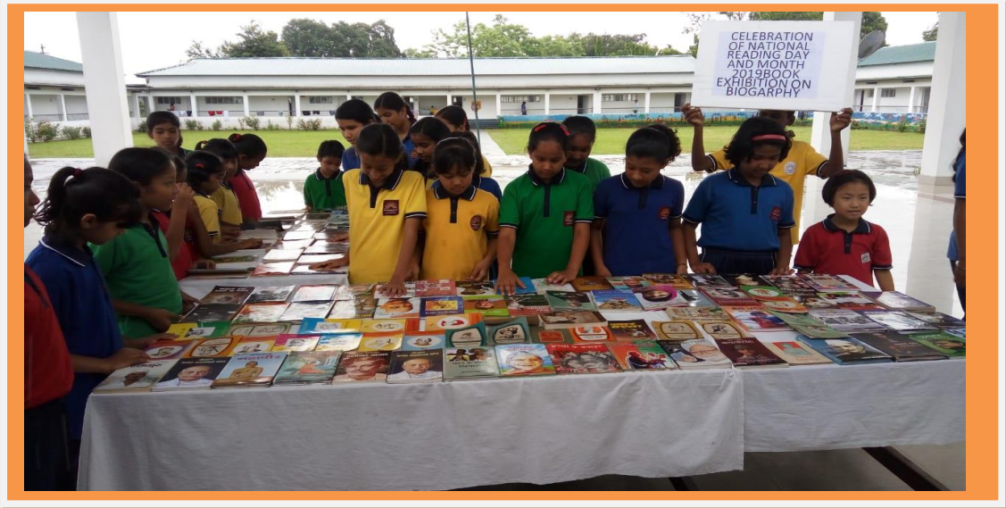
“ किताबो की प्रदर्शनी”