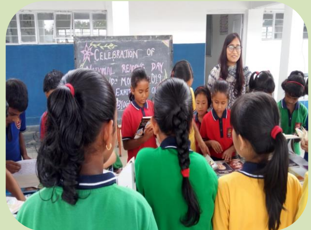
किताबो के बारे में जानकारी लेते हुए

“ THERE IS NO FRIEND AS LOYAL AS A BOOK”