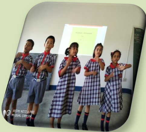
"SAYING GOOD MORNING IN SPECIAL WAY"